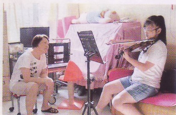
欣樺媽媽（左）稱即使家境欠佳仍希望女兒繼續學音樂。

「希望之聲少兒弦樂團」每位成員都來自基層家庭，衣食住行等開支蠶食了家庭全部收入，要父母每個月從腰包掏出數百元支付學費學音樂，乃至一筆過以數千元購置樂器可說是天方夜談。免費學習音樂的機會從天而降，這條音樂之路會引領這群孩子走到哪裏去呢？