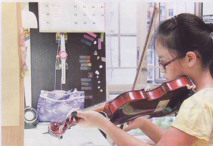
樂器價錢高昂， 團員可借用樂器 回家練習。